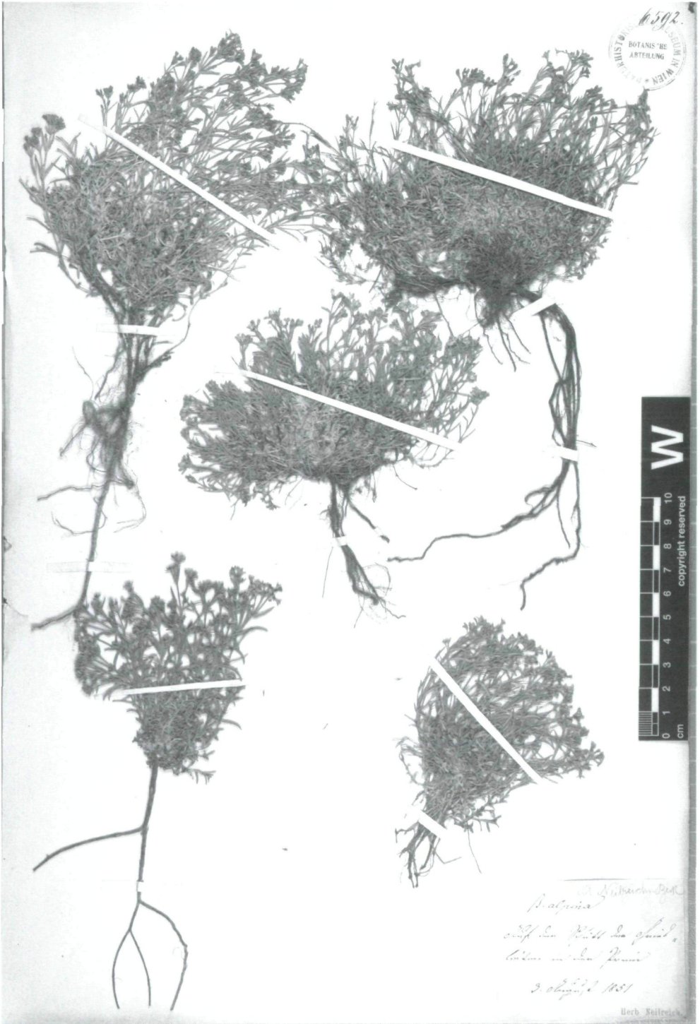
Fig. 2: Asperula neilreichii , Lektotypus.