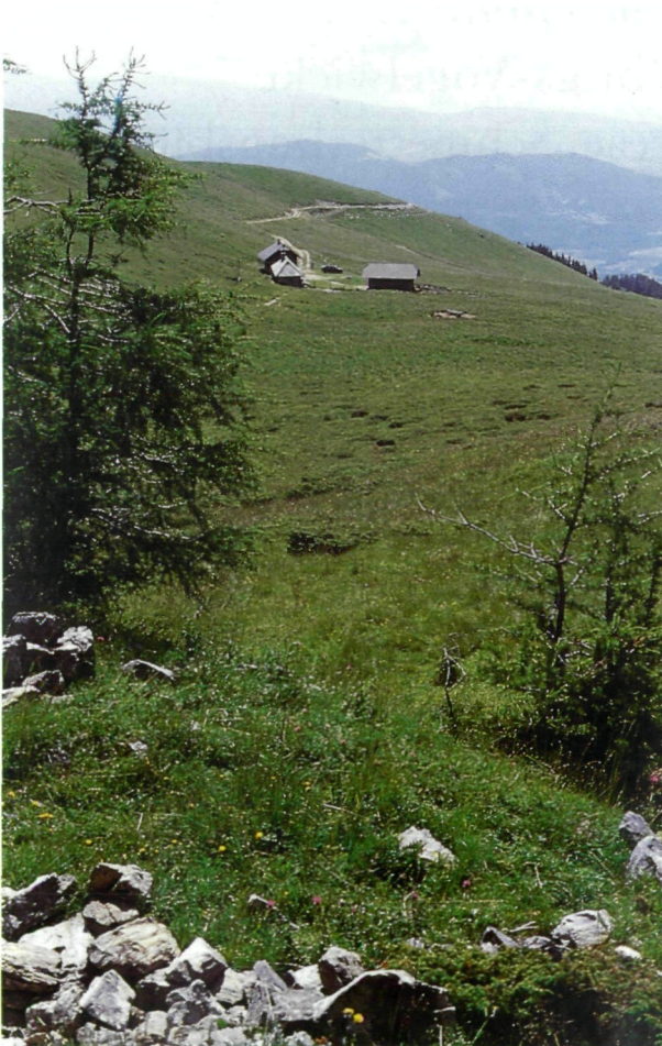
Abb. 1: Gunzenbergalm auf der Grebenzen/Metnitztaler Alpen in Nordkärnten, Fundort von Vicia oreophila , 1993 (Foto: G. H. LEUTE).

Grebenzen im steirisch-kärntnerischen Grenzgebiet der Metnitztaler Alpen gesammelt und von PACHER auf der Herbaretikette als „ Vicia cracca L. forma pygmaea? “ bezeichnet (PACHER in sched.), während dieser Fund in seiner Flora von Kärnten (1887:401) unerwähnt bleibt. Erst in allerneuester Zeit (1991) wurde Vicia oreophila von E. HÖRANDL und B. WALLNÖFER für die westlichen Bereiche der Grebenzen (Quadrant 8951/4) (vgl. HARTL & al. 1992:398) nachgewiesen, ich fand sie 1993 im östlich anschließenden Bereich der Gunzenbergalm (Quadrant 8952/3) in schönen Beständen (Abb. 1 und 2), HÖRANDL (in litt.) auch 1993 beim sog. „Schlund“ im selben Quadranten. Sie wächst hier in mit Kalkblöcken durchsetzten, teilweise beweideten subalpinen Rasenfluren des Seslerio-Semperviretums. Aus der Umgebung von Weißbriach (Quadrant 9345/1) fehlen bisher rezente Nachweise, und es wäre sicher lohnend, nach dieser seltenen Pflanze vermehrt Ausschau zu halten.