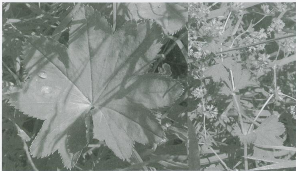
Abbildung 2. Alchemilla baltica . 08.06.2008 nahe Höfen. Grundblatt (links) und Blütenstand (rechts). Figure 2. Alchemilla baltica . 08.06. 2008 near Höfen. Basal leaf (left) and inflorescence (right).

Wenn man einen Vergleich mit den anderen Alchemilla -Arten und deren Vorkommen in der nordwestlichen Eifel zieht, gibt es nicht den geringsten Hinweis auf einen synanthropen Ur-