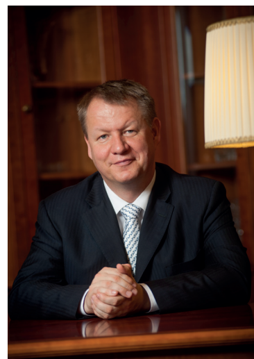
Svatopluk Němeček ministr zdravotnictví ČR

MINISTERSTVO ZDRAVOTNICTVÍ ČESKÉ REPUBLIKY