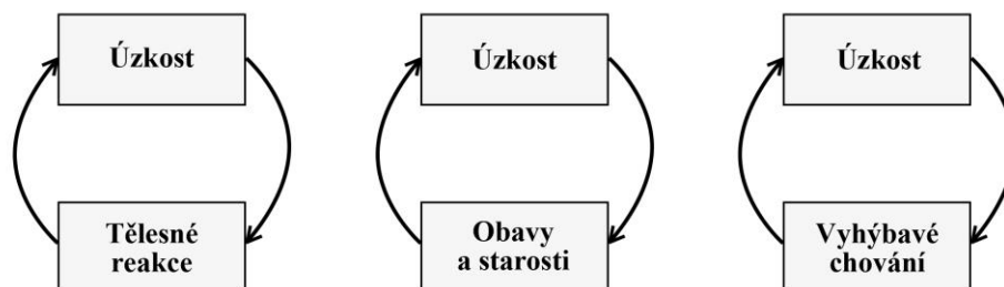
Obrázek č. 2: Bludné kruhy úzkosti 128

nebezpečí, a tak na základě mnohdy nevyhnutelných situací dochází k různým formám úniku . U dětí v akutní tíživé situaci, které jsou většinou úzkostné nebo depresivní, dochází k náhlým poruchám chování . Chování jedince může poukazovat na problém, a být tak voláním o pomoc. Dítě jedná v panice s domněním, že by mu toto počínání mohlo pomoci uniknout z konfliktní situace. 127