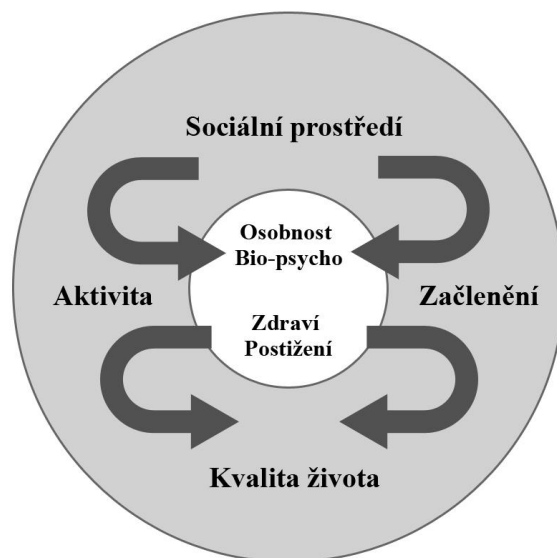
Obrázek č. 1: Biopsychosociální model funkčnosti 19

prostředí. Na postižení je pohlíženo jako na výsledek vzájemného působení mezi osobnostními faktory, externími faktory a zdravotním stavem . Jedinec s poruchou chování a emocí bývá posuzován na základě tří rovin, a to roviny osobnostní (individuální), biografické a sociální. 18