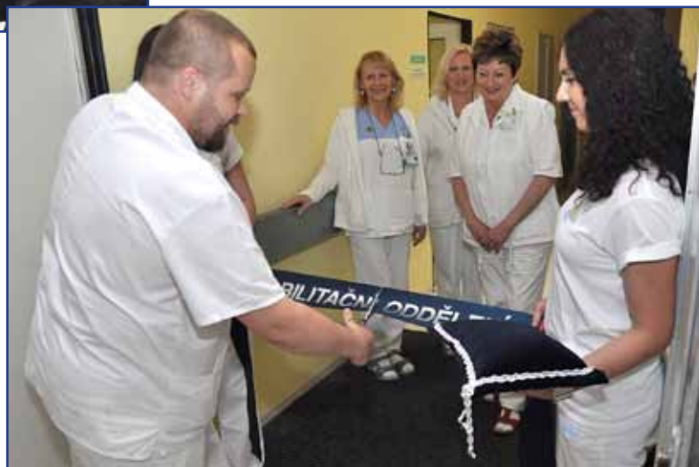
▶ Dne 28. května 2014 byly slavnostně otevřeny zrekonstruované prostory Rehabilitačního oddělení v pavilonu P.