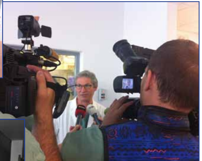
▲ Dne 31. října 2014 se uskutečnil 1. veřejný živý přenos intervenčního zákroku na srdci v ČR.