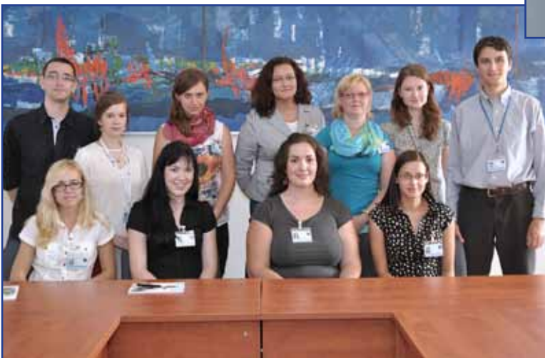
▲ Dne 1. září 2014 byl zahájen 1. adaptační program pro lékaře v ČR.