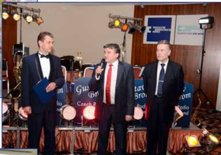
▲ Dne 1. března 2014 se konal Reprezenční ples brněnských fakultních nemocnic.