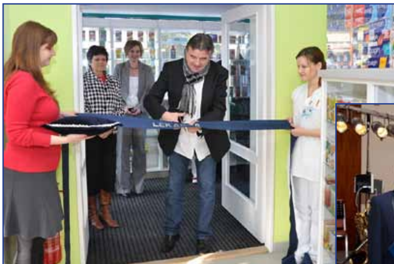
◀ Dne 4. února 2014 byla v bohunické nemocnici, u vstupu z ulice Jihlavské, slavnostně otevřena nová lékárna.