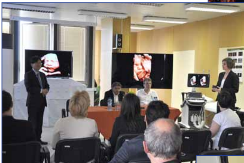
◀ Dne 24. dubna 2014 bylo otevřeno 1. Samsung Ultrasound Training Center na světě.