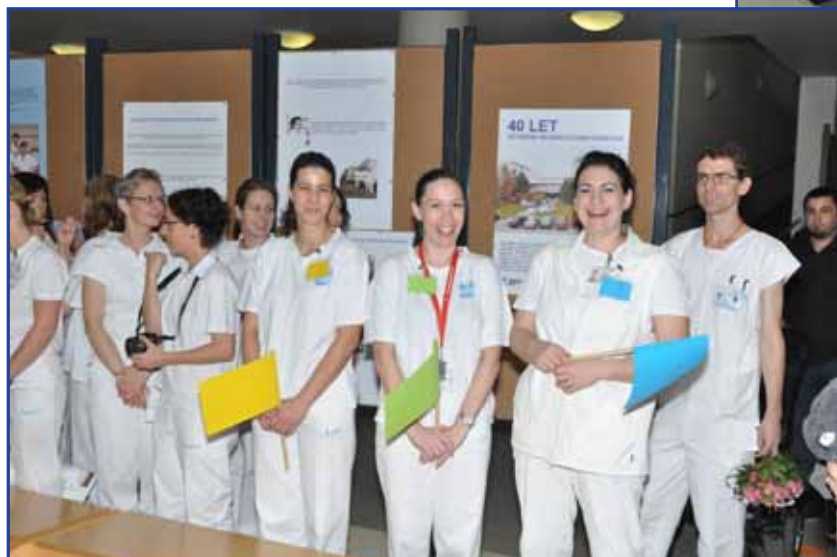
◀ Dne 20. listopadu 2014 probíhaly oslavy 40. výročí založení Dětského rehabilitačního oddělení.