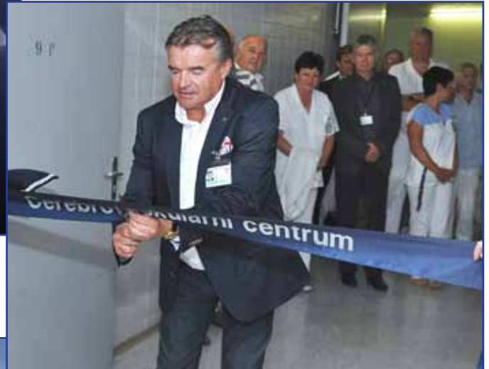
▲ Dne 20. srpna 2014 bylo slavnostně otevřeno zrekonstruované Cerebrovaskulární centrum.