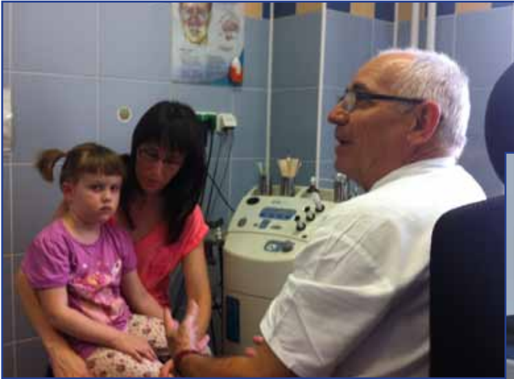
▲ Dne 17. července 2014 byla na Klinice dětské ORL provedena první oboustranná implantace u dítěte v ČR.